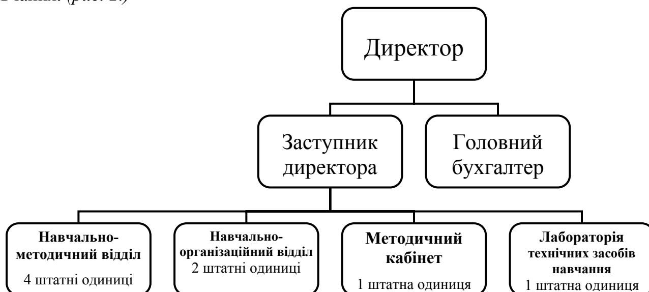
Рис. 2. Структура Івано-Франківського обласного центру перепідготовки та підвищення кваліфікації працівників органів державної влади, органів місцевого самоврядування, державних підприємств, установ і організацій

До структури центру входять навчально-методичний, навчально-організаційний відділи, методичний кабінет і лабораторія технічних засобів навчання. (рис. 2.)